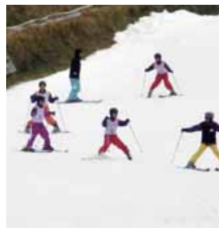
▲初心者でも大丈夫！

■対象 小学4年生以上の初心者(初めての参加者優先) ■日時 12月23日(土・祝) 9時～17時