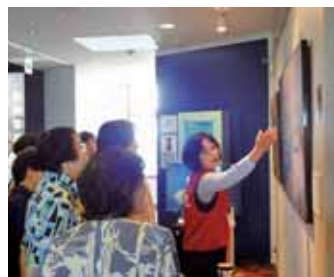
▲まもなく明治維新150年。佐賀の偉業・偉人を学び、おもてなしをしませんか。

■対象 ボランティアガイドに興味・熱意がある人 ■日時 平成30年1月20日、27日、2月3日 土曜開催 9時30分～11時30分 ■場所 佐野常民記念館 ■募集人員 先着25人 ■主な活動内容 施設の案内、展示史料等の説明、研修会への参加 ■申込方法 記念館に設置のボランティア登録申請書(市ホームページ、佐野常民記念館ホームページからダウンロードも可)をご提出ください。 ■申込期間 11月1日(水)～30日(木)