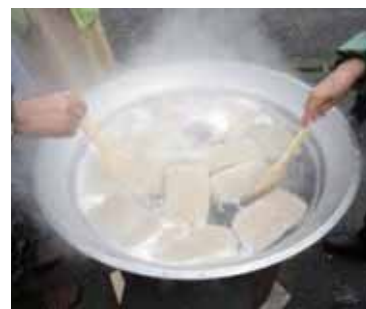
▲昔ながらの、柔らかくてプリプリしたこんにやくになります！

■場所 さが21世紀県民の森 木工センター(富士町古場724) ※現地集合・解散。 ■定員 先着30人程度(小学生以下保護者同伴) ■参加料 中学生以上 2,000円 ・3歳児以上 1,000円 ※保険料、体験料、昼食代含む ■持ちこるもの 暖かい服装、帽子、エプロン、タオル、筆記用具 ■申込期限 11月21日(火)