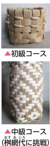
▲初級コース ▲中級コース (枳網代に挑戦)

■日時 10月22日(日) ●初級コース(小学4年生以上の親子、初心者向き) 9時30分～12時30分 ●中級コース(経験のある人、手芸等ができる人向き) 13時30分～16時30分 ■場所 東名縄文館(金立町千布・巨勢川調整池内) ■内容 クラフトテープで東名遺跡のかごに使われていた編み方で小型のかごをつくりまわす。 ■材料代 200～300円程度 ■定員 各先着25人程度 ■申込期間 10月3日(火)～16日(月) ②・③共通 ■申込方法 氏名、住所、電話番号を電話、ファクス、電子メールで申し込みください。