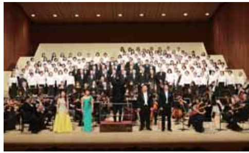
◎第22回佐賀県民第九公演

※詳しくはサガテレビホームページをご覧ください。 ◎申し込み・問い合わせ さが県民第九公演 実行委員会 ☎31・2273 FAX31・2209