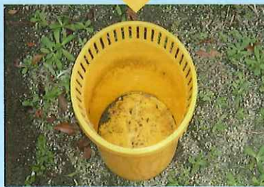
2. プラスチック容器 外に出さない 逆さにして水を溜めない