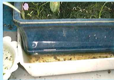
3. 植木鉢の受け皿 2週間に1度清掃

他にも側溝のタメマスや古タイヤ、空き缶や空き瓶などが発生源になります。 タメマスにはネットなどを張り、他のものには水が溜まらないようにしましょう。