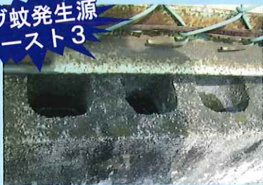
1. 境界ブロックの穴 穴をふさぐ