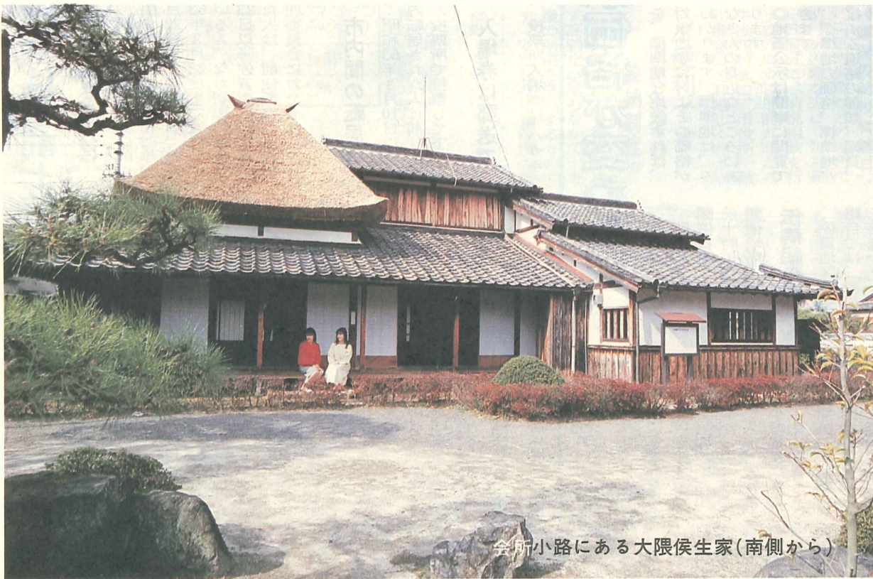
全所小路にある大隈侯生家(南側から)