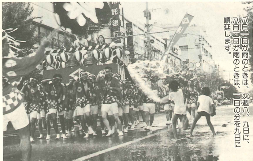
昨年 の 大人みこし

まつりまであと一ヶ月。市内の各事業所、団体等のご支援をいただき、まつり気運も高まっております。また、「おまつりタオル」を販売し、おまつりムードを盛り上げ、市民総参加を呼びかけております。皆さん、家族そろってのご来場をお待ちしております。おどり講習会 七月九日の午後六時半から八時半まで市青年の家、七月十四日と二十一日の午後二時から四時まで市勤労者体育センターで行います。