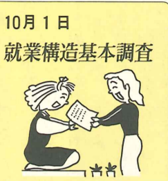
10月1日 就業構造基本調査

市では、このたび重度の心身障害者の福祉の向上を図るため、タクシー料金の一部を助成(タクシー券交付)することになりました。 ◎対象者(1)市内に一年以上住所を有する人(2)身体障害者手帳又は、療育手帳を所有している重度の障害者で次に該当する者。 ア、視覚障害、肢体不自由(下肢・体幹)一級又は二級 イ、精神薄弱、療育手帳A ◎申請受付10月15日(木)より、身体障害者手帳又は、療育手帳と印鑑を持参し市福祉事務所社会課(☎番窓口へ。お問い合わせは☎内線386)。