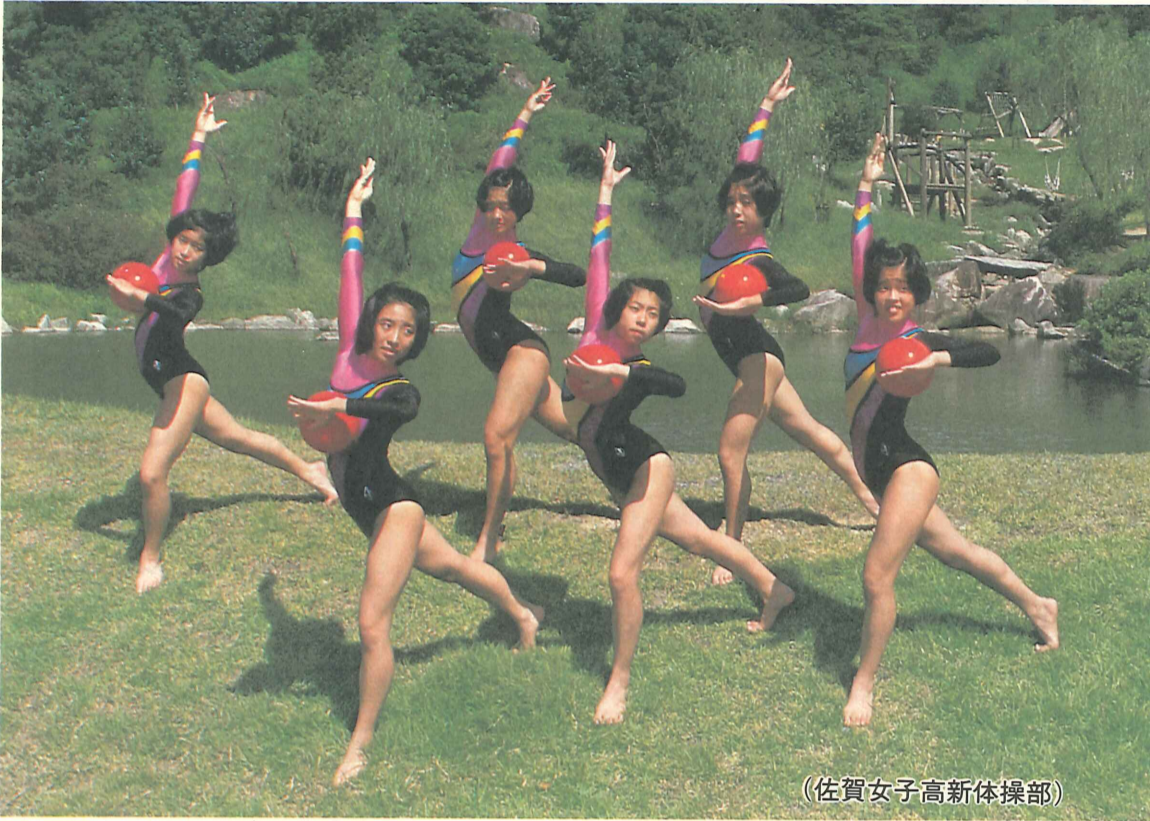
(佐賀女子高新体操部)