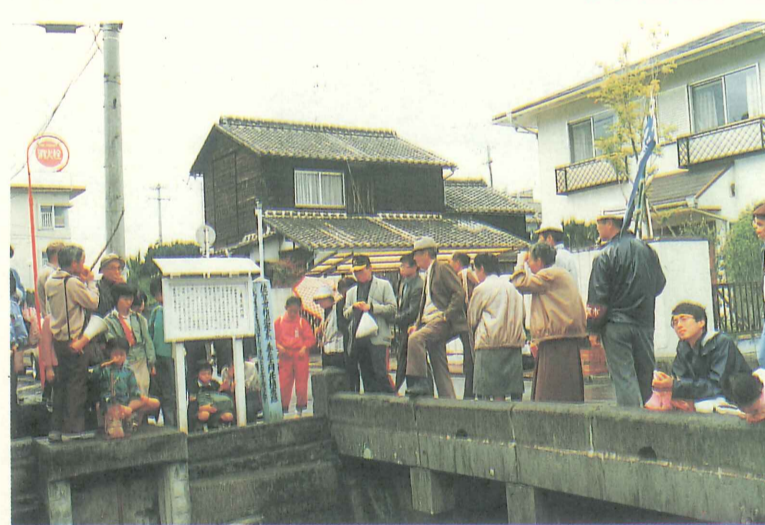
護国神社北の善左門橋 61年4月