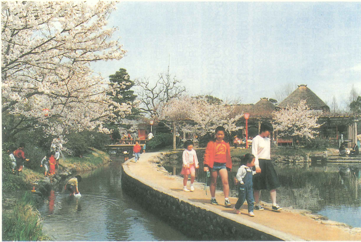
花見でにぎあう神野公園 61年4月