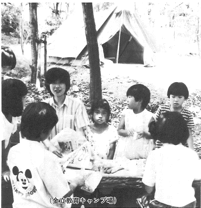
(金立教育キャンプ場)

●医療費が増えると 医療費の増加は、増えた分に比べて、みなさんが納められた保険税を値上げして、これを補うことになっていきます。しかし、今日のように増えつづける医療費に合わせて、保険税を値上げしたのでは、みなさんの負担が大きくなり、たいへんです。むしろ、医療費がなぜ増えるかをよく理解して、限られた財源のなかで、適切な医療を受けられるようご協力をお願いします。