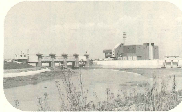
水害解消のための蒲田津の排水機場が完成。

私はこの市の第十四代の市長です。宮田前市長から要請されてこの市長職についたのは、春たけなわの昭和五十四年の五月でした。