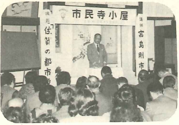
もっと知ろうさがのよさ。