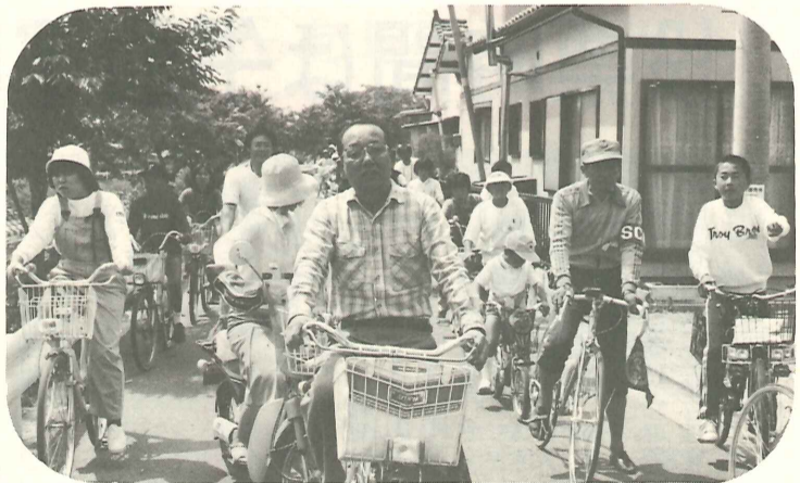
「長崎街道見て歩き」「葉隠の里サイクリング」で歴史再発見。

皆様から戴きました香典返し、一般寄付の貴重な浄財は、低所得世帯、心身障害児・者、老人福祉、ボランティアの育成等の福祉増進に幅広く使わせていただいております。佐賀市社会福祉協議会 (敬称略)