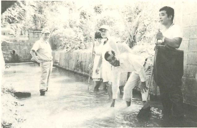
やればできる。川だってみんなの力できれいになる。

宮島前市長は、昭和五十四年五月市長就任以来、「活気あふれる水と緑の文化都市」を基本理念として、魅力ある都市づくりをめざし水、緑、道路、福祉、教育など市民生活最優先の施策を推進。住みよい、豊かな佐賀市の発展に努力してきました。