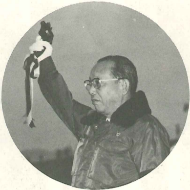
2年後の世界大会を全市民で盛り上げよう。