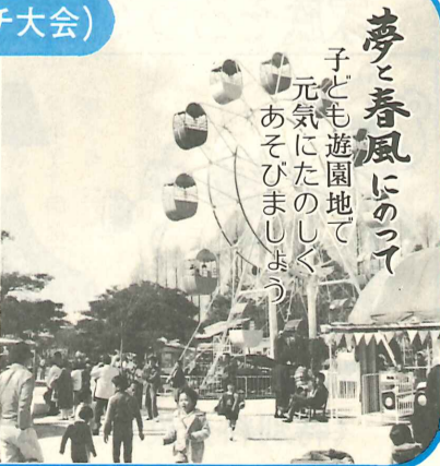
夢と春風にのって