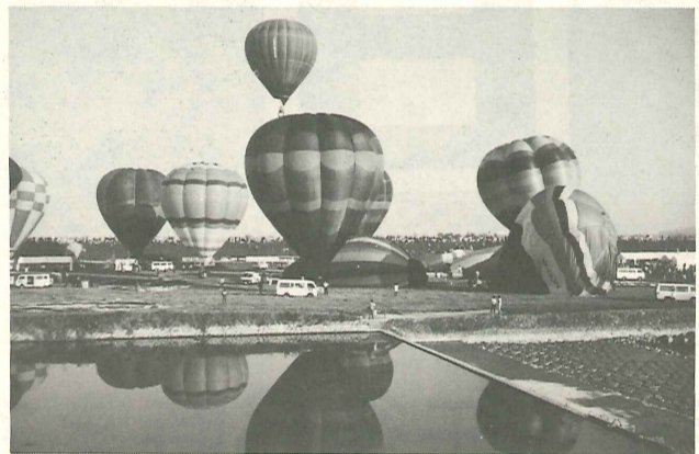
すっかり佐賀の新名物となったバルーンフェスタ