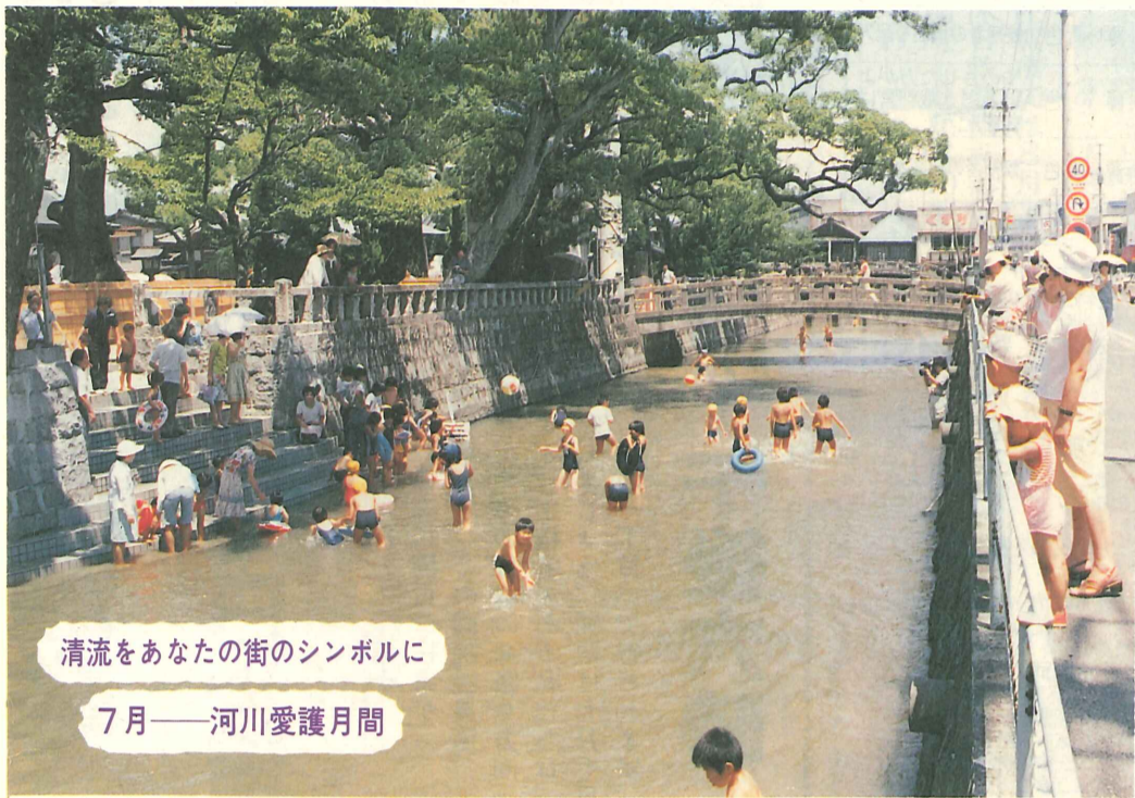
清流をあなたの街のシンボルに