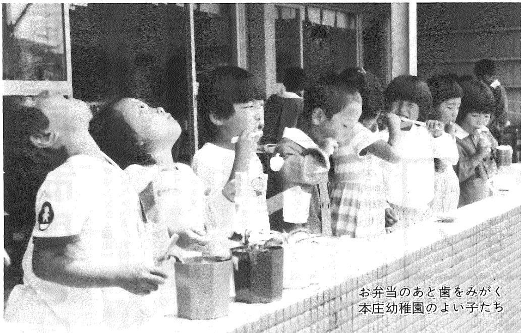
お弁当のあと歯をみがく 本庄幼稚園のよい子たち