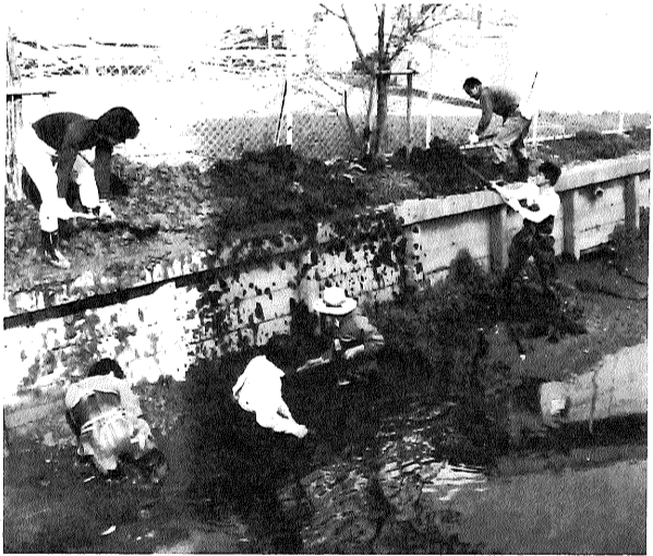
大学構内の川を清掃される佐大職員のみなさん