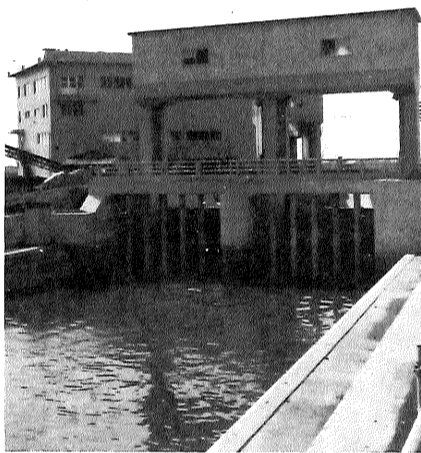
八田江排水ポンプ場(東与賀町)

策事業と取り組んでいます。六年度に完成と、嘉瀬川 まず北部地区では佐賀導水事業(筑後川と嘉瀬川を約二十四キロメートルの水路で東西に結び、山間地から流入する水をカットする)と、東 湖調整池設置(巨勢川の東部地区では蒲田津排水ポンプ場(運池町、排水能力は暫定毎秒三十トで六十年度目排水ポンプ場(西与賀町、雨期から稼働)と新川改修