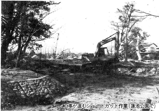
工事が進むショートカット作業(蓮池公園で)

市の東部地区とその周辺の排水対策に大きな威力を発揮する佐賀江川の改修工事が始まりました。 蛇行する流れを直線化し、川幅を現在の二、三倍に広げるもので、六十年度内完成を目標としています。 工事は、八田江分流量から蒲田津排水ポンプ場までの佐賀江川の約九キロメートルを、ショートカットして、五、二キロメートルに直線化し川幅を約