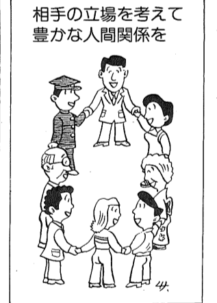
相手の立場を考慮して豊かな人間関係を

「さくら草の詩(映画)を見て」で終わりましたが、最後はとくに町内の分館長会を扇町として頂き、反省会にも参加してもらいました。主な反省の中には、「私はこんな学習会にはじめて参加しましたが、毎回は有意義なお話でいつも学級の計画表を手帳に控えて、学習日は他の用事を早く済ませ参加するように心掛けました」とか、「同和問題という自分と無関係のように思っていました。他人事ではなく自分自身の問題ということがよくわかりました。また、映画さくら草の詩は、何