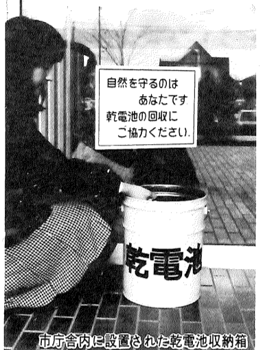
市庁舎内に設置された乾電池回収箱

「燃やせるゴミ」「燃やせないゴミ」の分別について、はじまりしめくりの協力をいただいているところですが、ゴミの処分分析が、約二割程度、不適当なゴミが混入していることがわかりました。ご面倒なこともわかりませんが、一度分別をきちんとするよう心がけをお願いします。