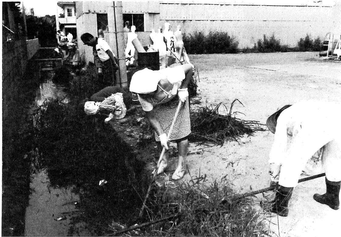
自分たちの川は自分たちできれいに（西田代一丁目）

「川を愛する週間」は今年で、五十七年秋に続いて、回で七回目。春の運動は四回目になります。春の期間中は川上頭首工がせきとめられるため、「川干」になり、泥上げができる状態になります。今回のスローガンは「川が生みだすまづくり」 で、五十七年秋に続いて、松原川、中ノ小路井樋、善左衛門井樋のモデル三水系にシジミを放流する計画です。また将来、市のシンボリックな存在でもある松原川水系の整備が考えられています。みなさんのご協力を