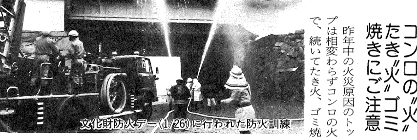
文化財防火隊(126)に行われた防火訓練

これから春先にかけては空気が乾燥し、一年の中で最も火災が発生しやすい季節です。そこで、毎年この時期の二月二十九日から三月十三日まで「春の全国火災予防運動」として、消防機関は特に注意を呼びかけています。 昨年一年間に発生した火災件数は七十九件、損害額一億一千五百万円、死傷者十六人と、火災は皆さんの貴重な財産のみならず生命までも奪ってしまいます。