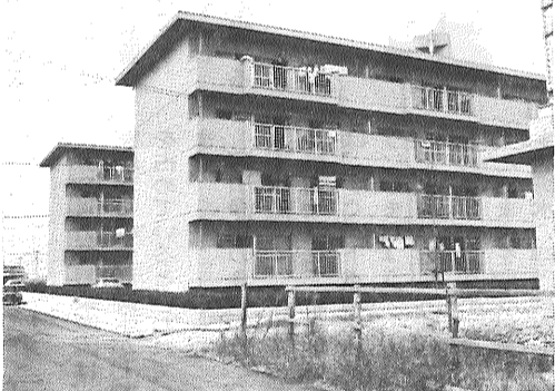
昨年建設された西佐賀団地

受験資格：昭和31年4月2日から昭和39年4月1日までに生まれた人で、市内居住者に限ります。受付期間：9月14日（月）から10月3日（土）まで。第一次試験：11月8日。受験手続き：受験申込用紙と実施要領は、市民相談室（1階）と人事課（7階）に備えています。郵送を希望される方は、封筒の表に「受験申込書請求」と朱書きし、必ず七十円切手をはったあて先明記の返信用封筒を同封し市役所人事課（栄町1番1号〒840）へお申し込みください。くわしくは、人事課（☎3151内線122）へ。