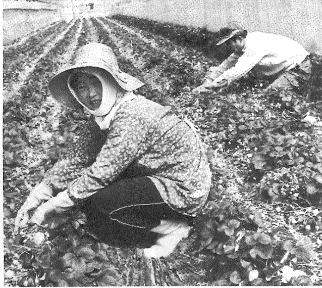
施設園芸で高度利用される農地