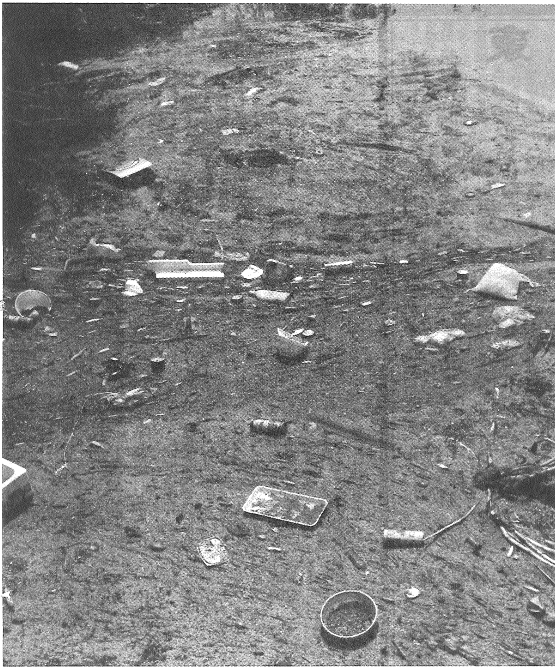
毎日とってもすぐたまるごみ (十間堀川、呉服橋付近)