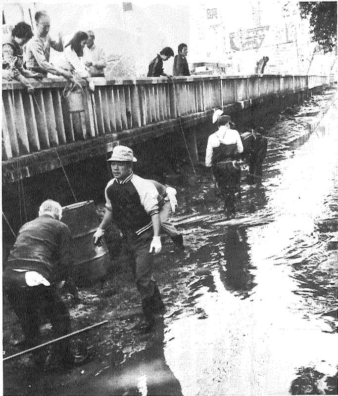
→総参加で松原川を清掃されたみなさん(56年3月)