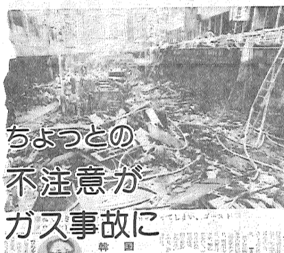
ちよつとの不注意がガス事故に