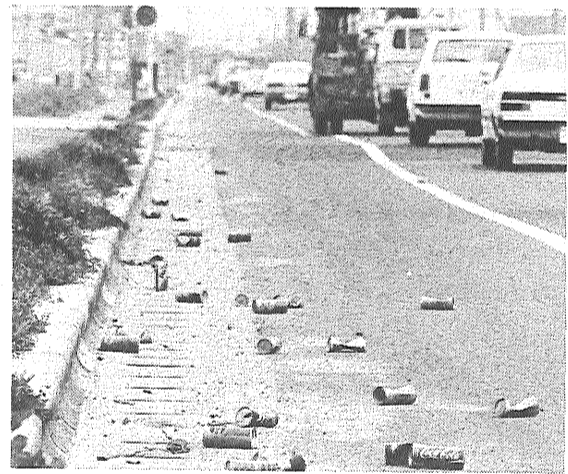
やめてほしいあきカンの投げ捨て