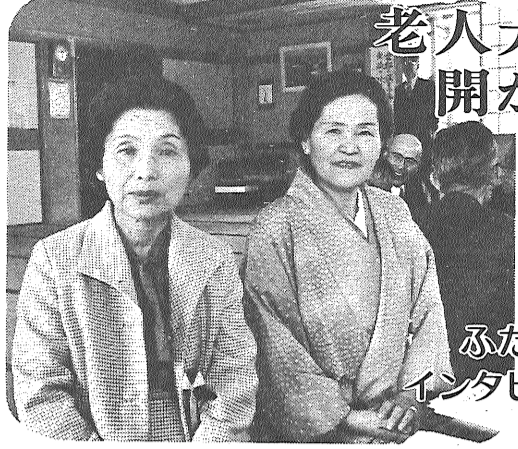
ふたりにインタビュー