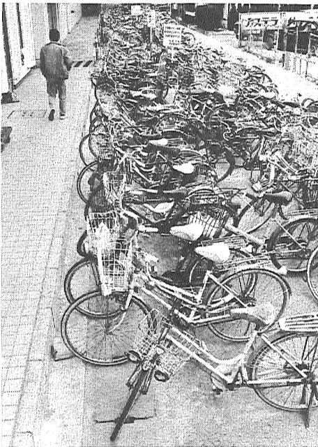
通行のじゃまになる自転車の放置

家から一歩外へ出れば、そこは道路です。私たちは、毎日、通勤、通学、買物、隣り近所のつきあいなどに使っています。また、生活必需品や生鮮食品などを運んでくれる大切なパイプであり、生活経済社会の基盤です。いつもは何げなく使っている道路も、何らかの支障が起きると道路の必要性、大切さに気づきます。住みよい街、豊かな生活環境をつくるため、あらためて市内の道路について考えてみましょう。自然の美しさを鑑賞するのにすぐれている日本人も一歩外に出ると、平気で、