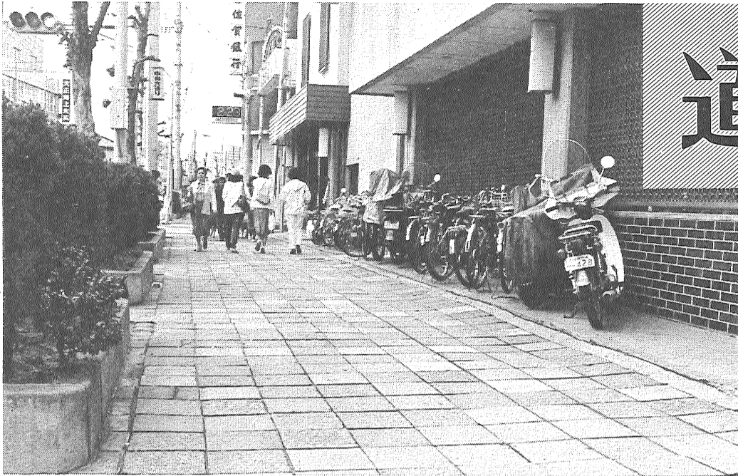
きれいに整理されている歩道