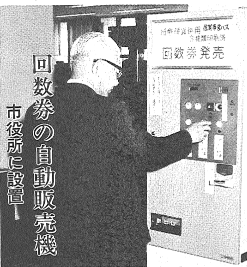
回数券の自動販売機 市役所に設置

たつては、教育委員会で、保護者からの申し出または学校長の自主的な調査に基づき、世帯票を作成し、福祉事務所長および民生委員とも十分連絡をとり、補助認定基準に照らし認定しております。五十四年度に引き続き五十五年度も補助を