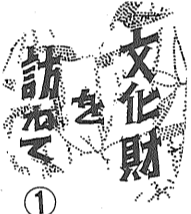
佐賀市重要文化財 御位牌所 一字

軽自動車税の納付は早目に 軽自動車税の納期は、五月三十一日までです。お近くの銀行、農協または郵便局で納めてください。