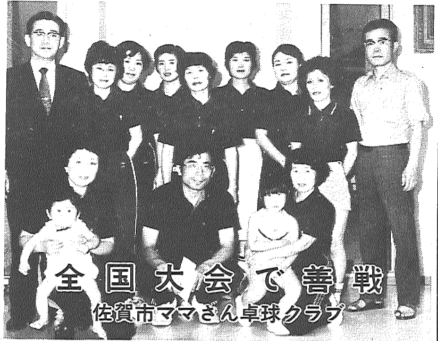
県大会優勝のあいさつに来た卓球クラブのみなさんと助役。