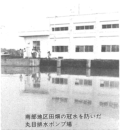
南部地区田畑の冠水を防いだ丸目排水ポンプ場

七月上旬の大雨で、市内各地に床下・床上浸水、農作物の被害等がでました。雨は、七月一日に一一・五・五、九日は一〇・五と集中して降り、五日か七日間で、実に雨量は四三・二に達しています。市はポンプによる排水試験を二か所で行いました。一つは本庄江川下流の西与賀町丸目のドンボ井樋に設置された排水ポンプ一基毎秒三・三の試験です。これは県営たん水防除佐賀南部地区事業で、丸目水路と本庄江川の接点に大型排水ポンプ場（ポンプ三基で毎秒十）を設置して、県道西与賀本庄線以南の田畑四百八十三の冠水を防ぐものです。このうち一基