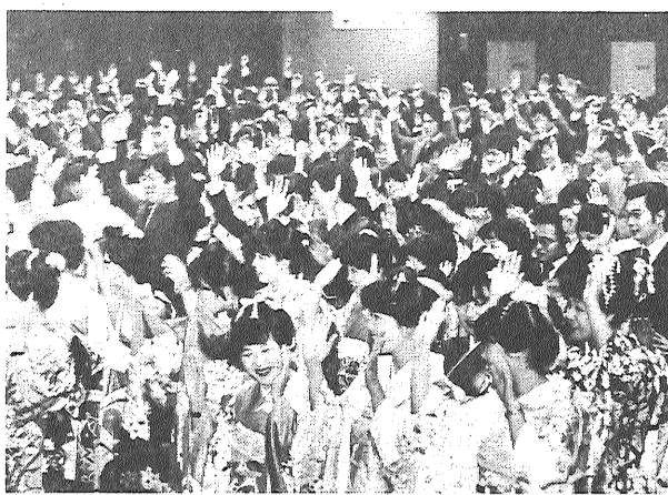
昨年の成人式風景

今日、一月十五日は、成人の日。法律的にも社会的にも一人前になったことを自覚し、みずから生きぬこうとする青年を祝いはげます。