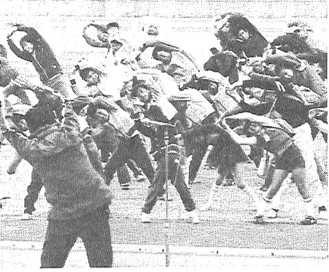
春の走ろう歩こう会から

十月十日は体育の日。日ごろ、運動やスポーツに縁のない方も、澄みきった青空の下で手足を伸ばし、スポーツの秋を家族みんなで楽しめませんか。 市は、第五回体力づくり市民体育祭を開きます。運動ができる服装で、気軽にご参加ください。 ▽と き 10月10日(水) 午前9時～午後2時 ▽とこ 県総合運動場 ▽プログラム ①開会式 ②ラジオ体操 ③競技(9時50分～12時) みんなで踊ろう、みんなで走ろう ④婦人ゲートボール(10時40分～14時) ▽主催 市教委、市体協、健康増進佐賀市民会議 受付は、婦人ゲートボール