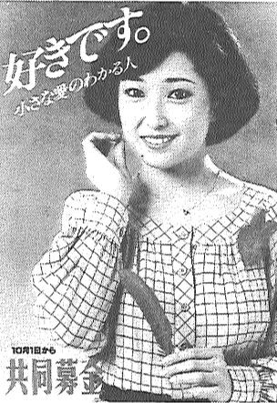
健康診断 市民結核健康診断

お気軽にご相談ください。 ととき 10月11日(木) 10時~15時 ととき 10月16日(火) 10時~16時 ととき 10月21日(日) 10時~15時