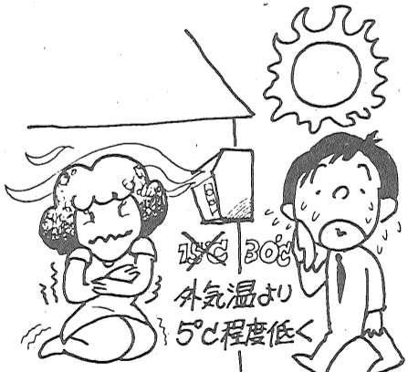
ルームクーラーの冷えすぎに注意を、