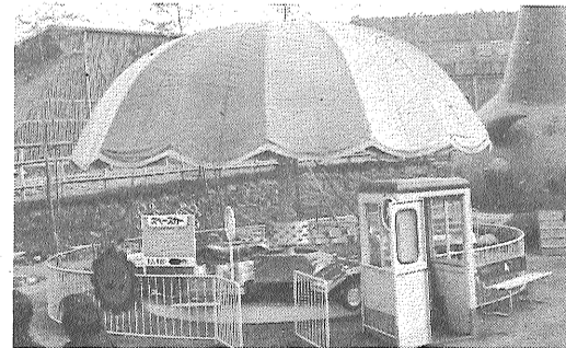
(新設遊機 具スペース・カー)

◆ 従業員募集 男子(六〇歳未満) 各若干名 女子(五〇歳未満) 各若干名 ◆ お濠端ポート場係 男子(六〇歳未満) 一名 ◆ 佐賀市内居住の心身健康な人 就業期間 三月から十一月中旬まで (ポートは十月中旬まで) ◆ 受付と面接日 二月二十二日(木)午前十時から 神野公園子ども遊園地で同時にいたします ● 履歴書を当日、本人持参のこと 詳しくは面接日に説明する ◆ 男女学生アルバイト募集 採用条件 日曜日のみ 期間 三月から五月までの間 人数 若干名 ◆ 受付と面接日 二月二十五日(日)午前十時から 子ども遊園地にていたします ● 履歴書を当日、本人持参のこと 詳しくは面接日に説明する 法人 佐賀観光協会 事務局 32837 遊園地 38461