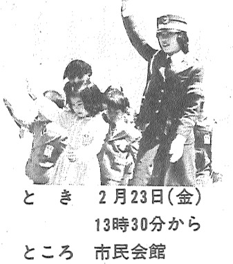
とき 2月23日(金) 13時30分から