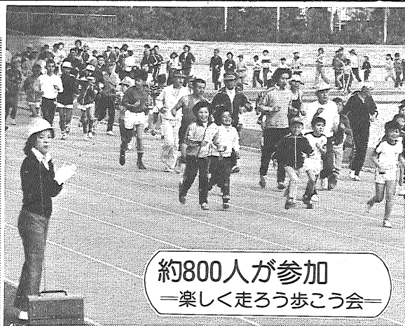
約800人が参加 楽しく走ろう歩こう会

三月九日、午前九時から健康増進・体力づくりを図るため、佐賀走ろう歩こう会が県総合運動場を中心に開かれました。