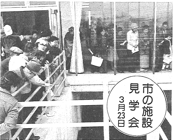
市の施設見学会 3月23日

三月九日、午前九時から健康増進・体力づくりを図るため、佐賀走ろう歩こう会が県総合運動場を中心に開かれました。