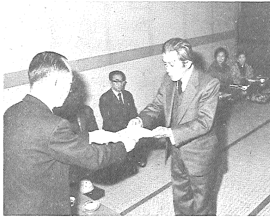
委囑状を受け取る民生委員さんら(高木瀬地区)