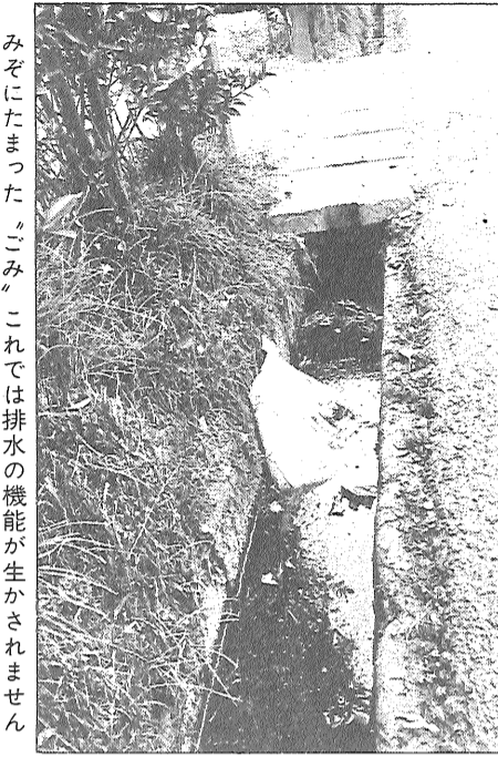
みぞにたまったごみ。これでは排水の機能が生かされません

六月十日、梅雨前線が十分に排水ができず道路がでても急激なもので、排水日本一帯に停滞し、佐賀地水たまりになっているところが、各所で豪雨に見舞われ、方も集中豪雨に見舞われ、ありました。各所で浸水、道路の冠水などの被害がでました。このとき、被害状況調査に回り調査してみますと、道路側こうなどの掃除を良くしてある地域は、排水が良く、各家庭からの排水もみぞなどにビニール袋、発泡スチロール片、あき缶、土砂などが詰まって、豪雨による急激な排水ができなくなっている箇所があり、