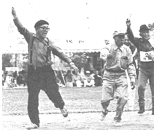
まつて、市老人スポーツ大会が開かれました。

5月25日、高木瀬町の県総合運動場のサブトラックに、お年寄り約五百人が集まって、市老人スポーツ大会が開かれました。 写真説明 (上) 入念に準備体操。 (中) ケツ庄は大丈夫？ (下) ロマンズ競争にハツスル、手に手をとって思わすにっこり。