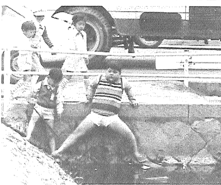
こんな場合に出会ったら、愛の一声を

これから本格的な水のシーズン。毎年この時期になると小さい子供たちが魚などをとっている姿をよく見かけます。配水された水が、増水した用水、池、溝など危険な場所には子供が立ち入らないよう立札、さく、ふた等を設置し、危険だと気づかせることが大切です。