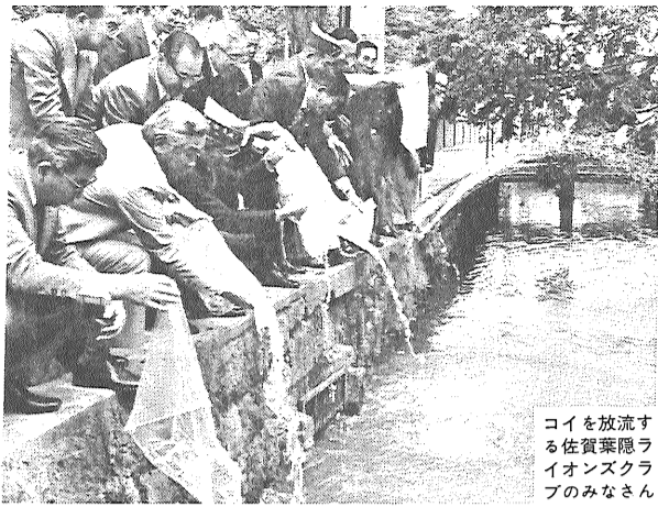
松原川に泳ぐコイ。市民の心を癒している。

佐賀市の名物として市民のみならず、かわいらしい川沿いを歩く人々の目を惹きつけてくれるコイが、川を泳ぐ姿が、松原川を彩り、その数が次第に増えているからである。 五月八日の昼には、佐賀市役所前川に、松原川に泳ぐコイが、市民の心を癒している。松原川は、四月の初め、松原川に泳ぐコイが、市民の心を癒している。松原川は、四月の初め、松原川に泳ぐコイが、市民の心を癒している。