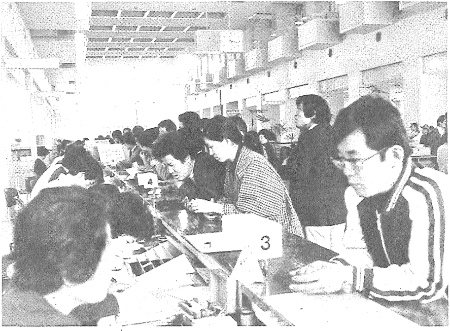
市民課窓口で扱う転出証明などの手数料が改定されます

障害者・老年者など所得80万円まで非課税 国保の課税限度額は17万円に 四月十八日、佐賀市議会臨時会が開かれ、市税条例の一部を改正する条例などが審議された結果、原案どおり可決しました。