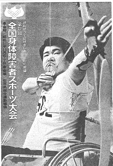
全国身障者スポーツ大会