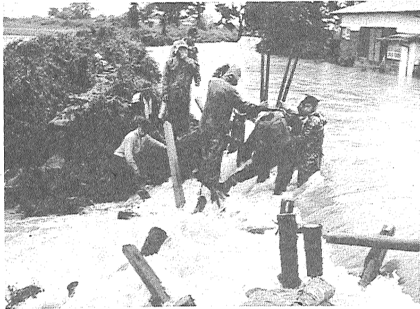
このような災害が再び... 47年7月の水害から

今年の「つゆ」は変動型影響もあり、「つゆ」が明 だといわれています。七月に入り梅雨前線の活 動は引き続き活発で台風のうごめきも 七月に入り梅雨前線の活 動は引き続き活発で台風のうごめきも