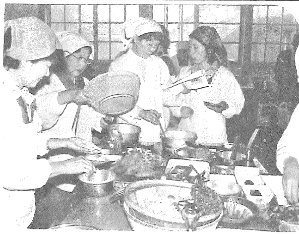
献立表を片手に味付けに一生けんめい。