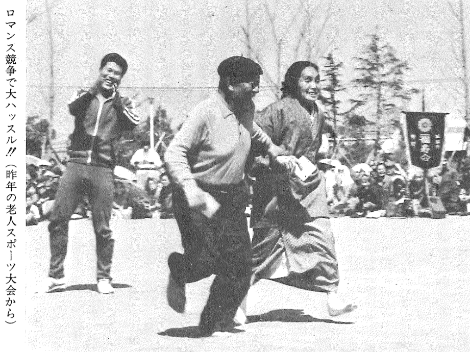
ロマンス競争で大ハッスル!! (昨年の老人スポーツ大会から)