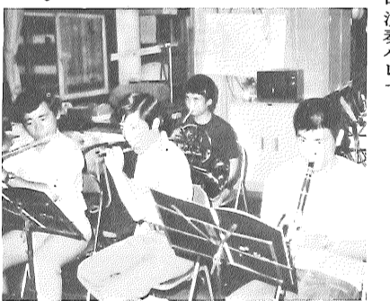
練習にはげむ消防音楽隊員

「納涼さがまつり」は市民のまつりです。ますます盛大なまつりになるといふ、みなさんの力で育ててほしいものです。