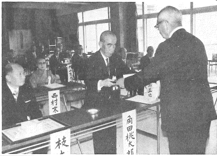
表彰をうける市政功労者のみなさん

昭和五十年年度市政功労者表彰式を四月一日、市民会館で行いました。これは、市が毎年、産業、文化、教育、保健衛生、自治活動、福祉などの面で郷土の発展に尽くされた方がたや善行のあった方たちを選んで、その功績をたたえ表彰しているものです。今年度は、次の三十三名の方たちを表彰しました。(敬称略)