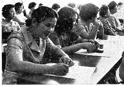
調理員さんを対象に、毎年開いているもので、この日は七十三人が出席、「つゆどきの食品衛生」と題する佐賀保健所の人の講義を真剣に聞きっていました。

今年のつゆ明けは、七月十九日の平年なみか、やや遅くなる見込みといわれています。この季節は、わたしたちの体の調子も狂いやすく、赤痢や疫病などの伝染病や食中毒が流行しやすいときです。そこで、市教育委員会は、日ごろ児童・生徒の健康管理に携わる学校給食調理員さんを市民会館に集め、つゆどきの衛生管理がいかに大切かについて講習会を開きました。この講習会は、完全給食をしている市内の小・中学校の調理員さんを対象に、毎年開いているもので、この日は七十三人が出席、「つゆどきの食品衛生」と題する佐賀保健所の人の講義を真剣に聞きっていました。