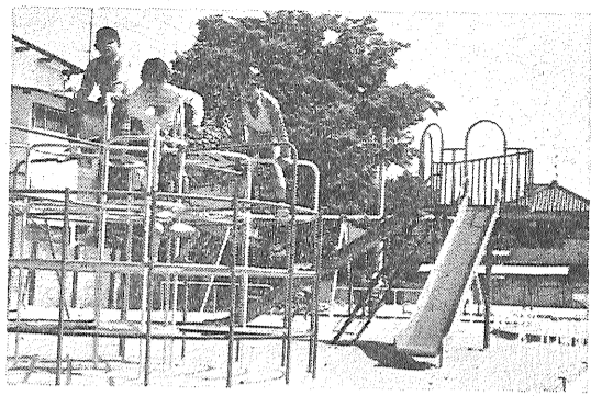
この公園は、北九州財務局佐賀財務部の跡地を利用して、佐賀市が、二月から約三百七十万円の費用で工事を行って、完成したもので、都市公園法に基づいてつくられた市内初の児童公園です。

市が建設していた中の小路の児童公園が完成、五月三日、五十本を記念植樹して開園をに地元の子供クラブや関係者が出席して公園開きをしました。 この公園は、北九州財務局佐賀財務部の跡地を利用して、佐賀市が、二月から約三百七十万円の費用で工事を行って、完成したもので、都市公園法に基づいてつくられた市内初の児童公園です。 約二千五百平方メートルの敷地に、メリーゴーランドやジャングルジム、ブランコなど六つの遊具を置き、水飲み場や便所も設けられており、遊び場の少なかった子供たちに喜ばれています。