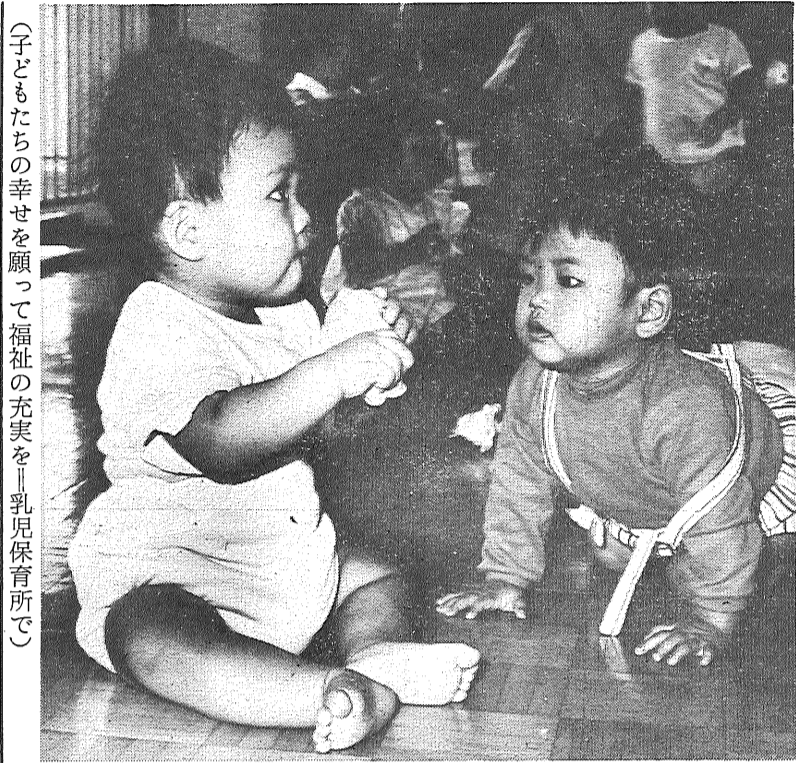
(子どもたちの幸せを願って福祉の充実を乳児保育所で)