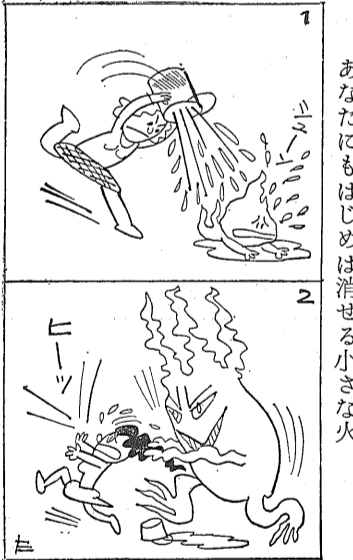
あなたにもはじめは消せる小さな火