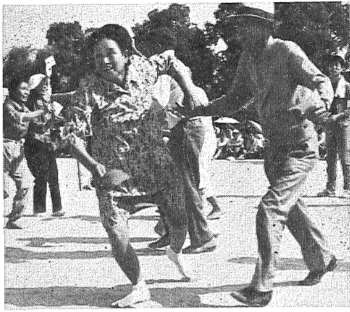
ロマンス競走でハッスルするおとしより

下痢をしたときは、むしろ栄養をとらなければいけません。オカユと梅干し—では、栄養の点、やはりものたりません。オカユの迷信、もういちど考え直してみたいものです。