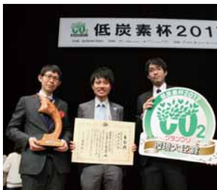
▲環境大臣賞グランプリを受賞した佐賀市上下水道局

低炭素社会の構築を目指す新たな温暖化防止活動を表彰する「低炭素杯2017」が2月16日(木)、日経ホール(東京都)で開催されました。約1,000件の応募の中から佐賀市上下水道局の「昔に帰る未来型く佐賀市下水浄化センターを「宝を生む施設」に」が環境大臣賞グランプリに選ばれました。