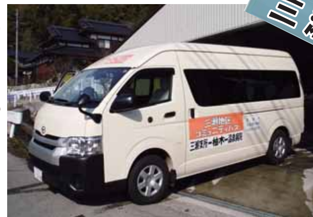
村外路線バス「みつせやまびこ号」