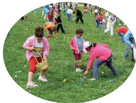
▲イースター・エッグ・ハント

4月は英語でエイプリル。ギリシヤ神話の女神「アフロディテ」に捧げられる月と言われています。また、ラテン語の「開く」から派生し、「開花の月」とも意味づけられています。そんな花が咲く暖かい4月に、「春を代表する行事」があることをご存知でしょうか。それは、イエス・キリストの復活を記念するイースター(復活祭)です。 イースターは、年によって日付が変わります。春分の日後の、「最初の満月の次の日曜」と決められています。これは、イエス・キリストの復活が日曜だったからです。 中世ヨーロッパ時代、イースターには豊穡の象徴「うさぎ」と、生命の始まりの象徴「卵」が関わるようになり、キリスト教徒にとってはク