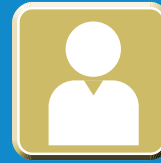
解雇等による 住居退去者世帯