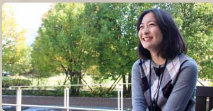
▲ふるさとの思い出を笑顔で楽しそうに語ってくれた。

料理は和食を作ることが多く、仕事を終えるとすぐに夕食作りに取りかかる。得意料理はお母さん直伝の肉じゃが。また、健康維持のため、週に2回ほどプールにも通っているとのこと。