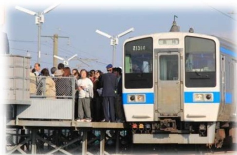
JRバルーンさが駅 (大会期間中の臨時駅)