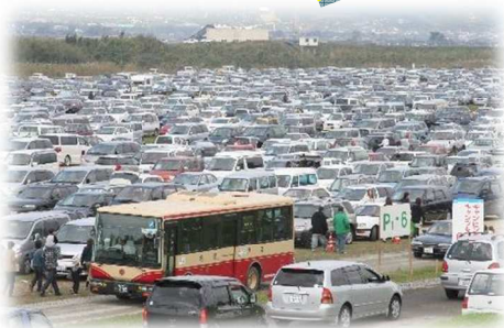
自動車で混雑している バルーン大会駐車場

来場者の自動車利用によるCO 2 排出を削減するため、パンフレットや雑誌記事、広報番組などで公共交通機関を使った来場を呼びかけました。