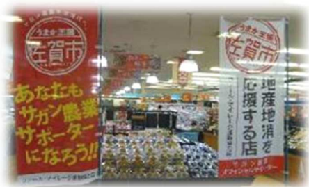
「ファーム・マイレージ運動」 協力店ののぼり旗