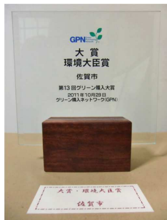
○平成27年度購入実績

全部署一斉に間伐材を使用したコピー用紙を導入している佐賀市の取り組みが評価され「第13回グリーン購入大賞」で最高賞の環境大臣賞に選ばれました。