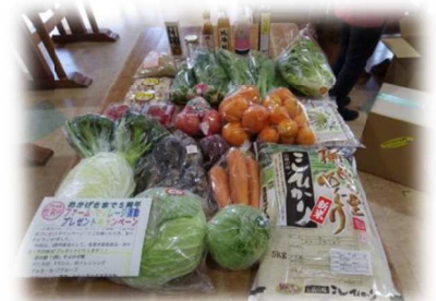
5周年記念賞プレゼント賞品