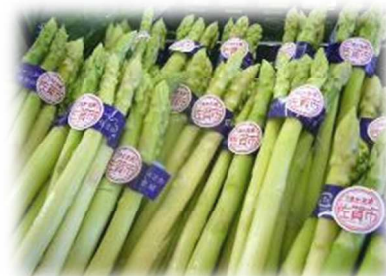
「うまさがない」を貼った市産農作物