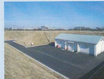
弾薬庫（習志野演習場）