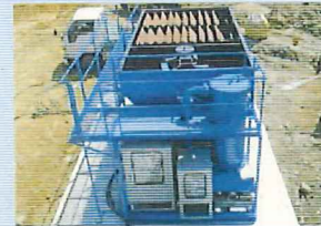
濁水処理装置