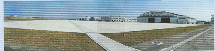
駐機場・格納庫（北徳島駐屯地）