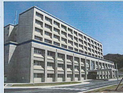
隊庁舎（高知駐屯地）