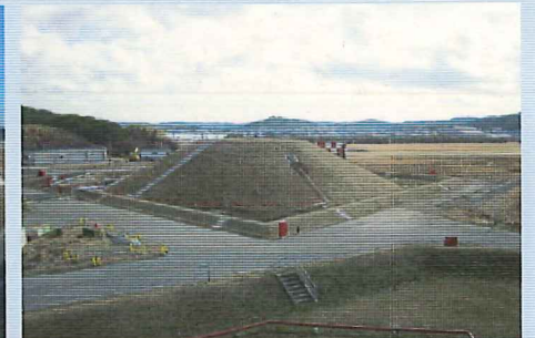
燃料タンク（館山航空基地）