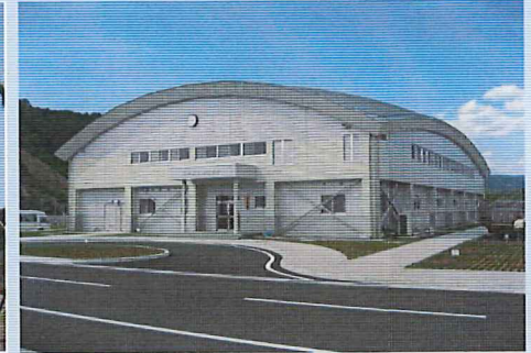
体育館（高知駐屯地）