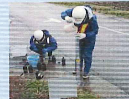
多項目水質計によるpH測定の様子