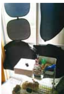
日よけでペットも涼しく!