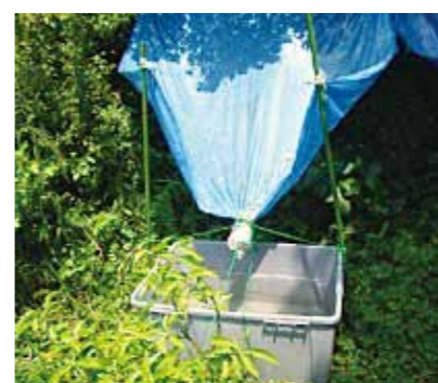
畑にまく水を確保

・緑のカーテンを育て、夏季の10%節電を達成(風呂の残り水を再利用、松ぼっくりで水分感知)。