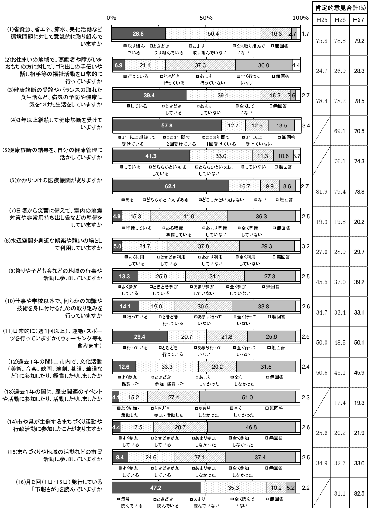
図 45 まちづくりに対する「実践度合い」(佐賀市全体)