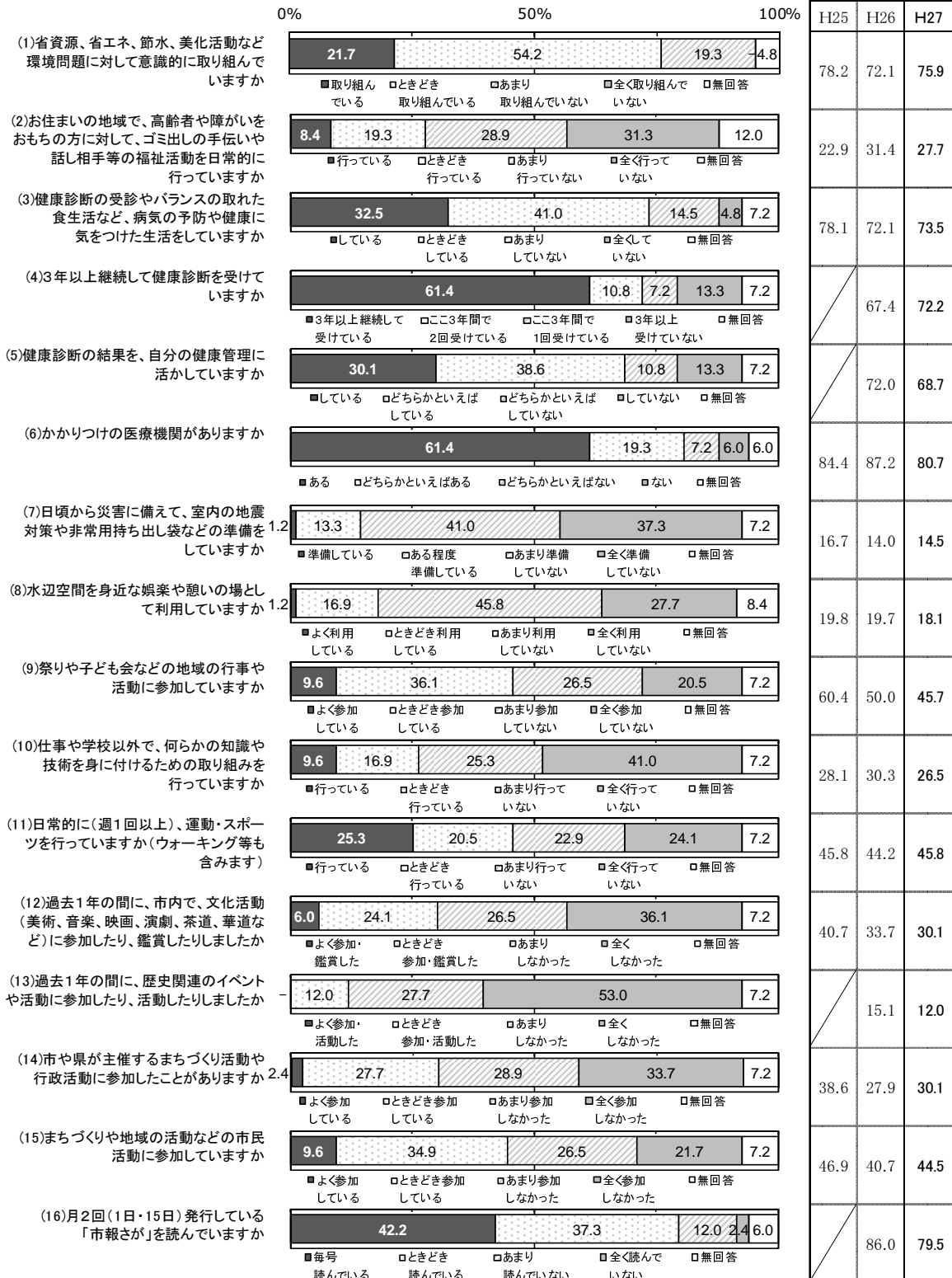
図 47 まちづくりに対する「実践度合い」(旧諸富町)

また、「(5)健康診断の結果を、自分の健康管理に活かしていますか」などの肯定的意見は他の地区より低くなっている。