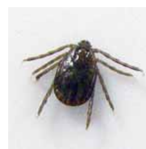
※マダニ 吸血前 (3~4mm)山口県撮影

平成23年に初めて特定された、新しいウイルス(SFTSウイルス)に感染することによって引き起こされる病気です。国内では、平成24年秋に初めて報告されました。