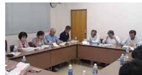
東与賀校区まちづくり準備委員会の様子

各種団体などの代表者で構成し、今後の進め方の打ち合わせや座談会などで出された意見の整理を行います。