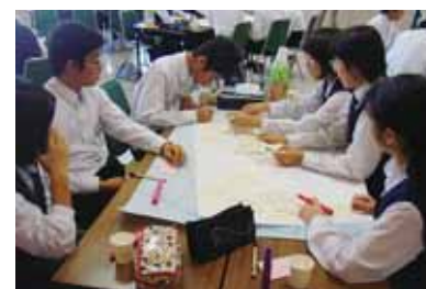
東与賀：中学生座談会

座談会やアンケートなどを行い、校区の魅力・課題、将来の校区の姿などについて住民の皆さんの意見を集めます。