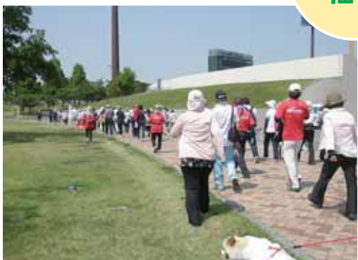
嘉瀬：ラジ&ウォーク