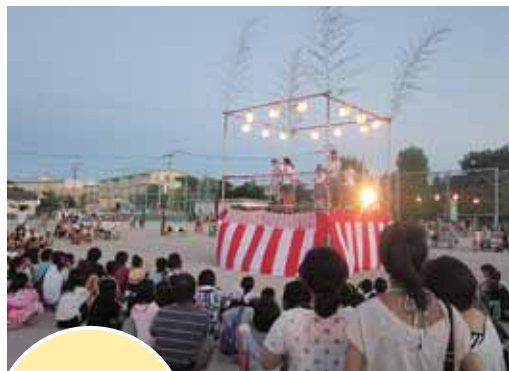
本庄：かたりべの里本庄祭