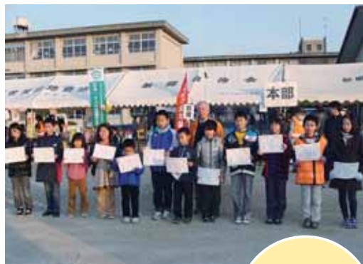
北川副：まなざしチャレンジカード