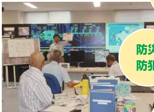
諸富：自主防災組織の立ち上げ