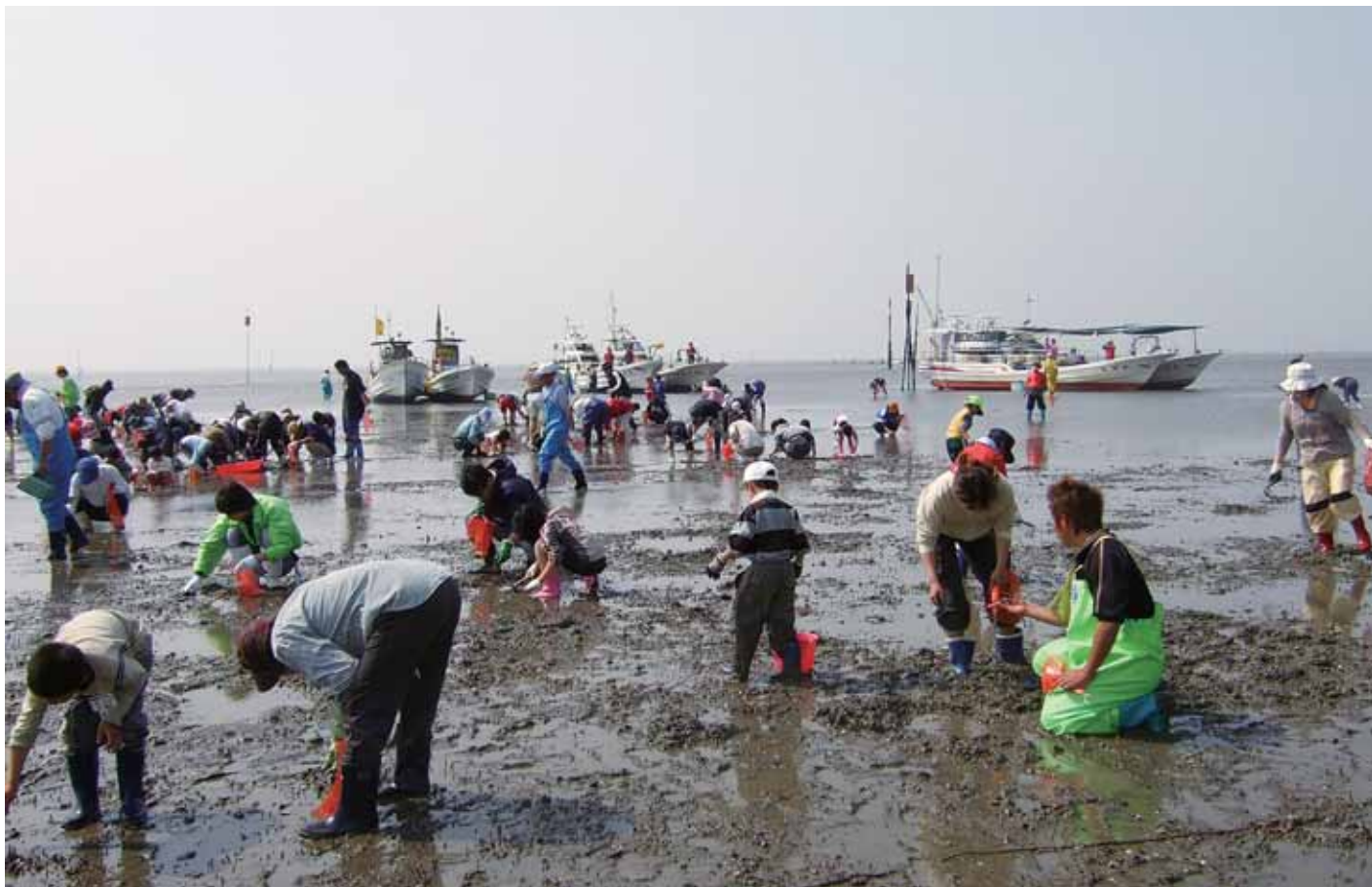
船で行く佐賀市 観光潮干狩り 4月25日(木)から 諸富町 5月28日(火)まで 川副町 5月29日(水)まで 出港場所・日時、料金、持ってくるものなど、詳しくはお問い合わせください。