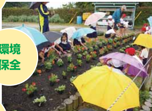
金立：みどりを楽しむ教室