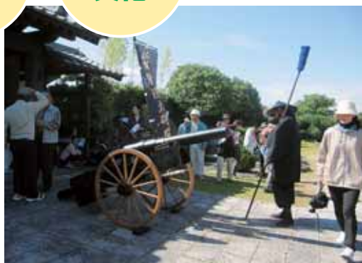
川上：歴史散歩の開催