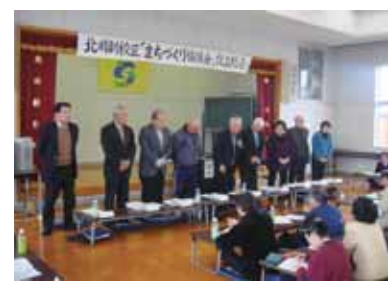
北川副まちづくり協議会設立総会