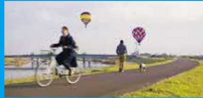
冬の朝の風物詩 バルーンが浮遊する通学路