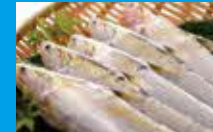
毎年僅かな時期にしか 食べられない幻の魚「えつ」