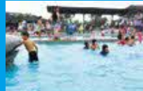
プールに遊具など、 一日中楽しめる「干潟よか公園」