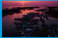
市の南側には日本一の 干満差を誇る干潟、 「有明海」が広がる