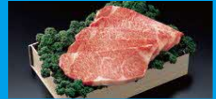
美しい艶サシを誇るブランド牛「佐賀牛」