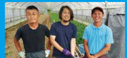
一人前の農家になるための支援制度も充実「佐賀市トレーニングファーム」