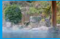
市の中心から車で30分で着く 「古湯・熊の川温泉」。地元から 「める湯」と呼ばれ親しまれている