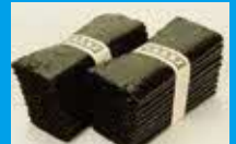
生産量・販売額ともに 日本一の「佐賀海苔」