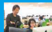
2016年以降多くのIT企業が進出 ※写真は(株)EWMファクトリー