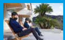
テレワーク環境も充実。 滞在にかかる経費を一部補助