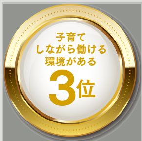
野村総研 「成長可能性都市ランキング2017」