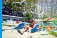
ジェットコースターなど乗り物が いっぱい！「神野公園こども遊園地」