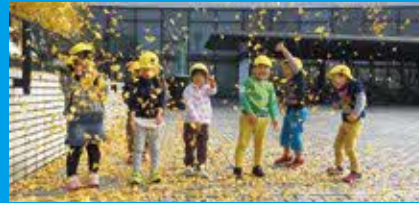
充実した保育環境で子育ても安心