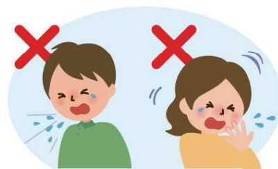
何もせずに咳やくしゃみをする 咳やくしゃみを手でおさえる