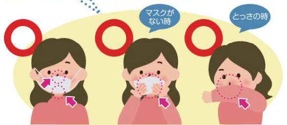
マスクを着用する (口・鼻を覆う) ティッシュ・ハンカチで口・鼻を覆う とっさの時 袖で口・鼻を覆う